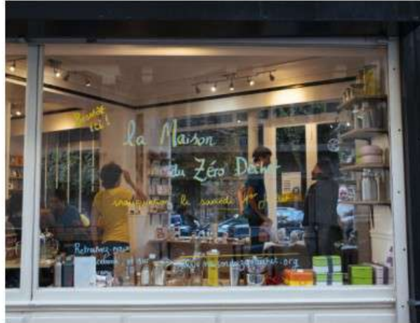
Inauguration de la Maison du Zéro Déchet. Paris, 1er juillet 2017.